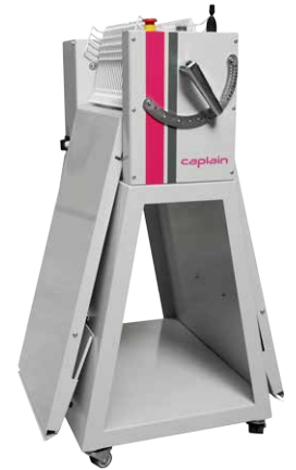
Position rangement Storage position